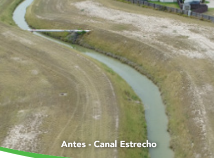
Antes - Canal Estrecho