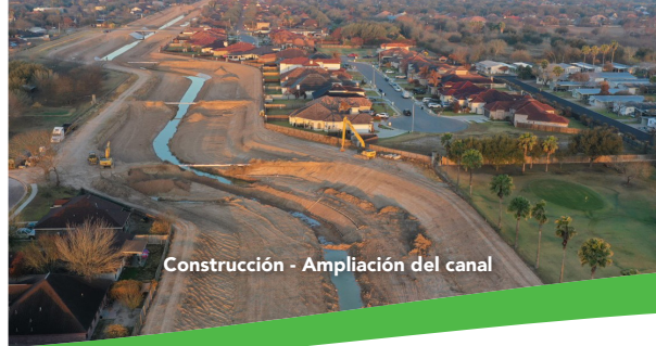
Construcción - Ampliación del canal