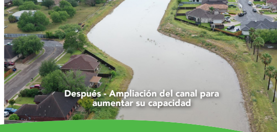
Después - Ampliación del canal para aumentar su capacidad